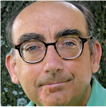
Aquesta imatge parla