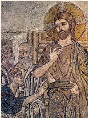
Crist respon a la incredulitat de Tomàs. Mosaic del segle XI (fragment), Monestir de Dafni (Grècia)

Ninguno pasaba necesidad, pues los que poseían tierras o casas las vendían, traían el dinero y lo ponían a disposición de los apóstoles; luego se distribuía según lo que necesitaba cada uno.