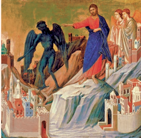
Les temptacions de Jesús al desert, pintura del Duccio (1235-1319). Col·lecció Frick, Nova York

En aquel tiempo, el Espíritu empujó a Jesús al desierto. Se quedó en el desierto cuarenta días, dejándose tentar por Satanás; vivía entre alimañas, y los ángeles le servían. Cuando arrestaron a Juan, Jesús se marchó a Galilea a proclamar el Evangelio de Dios. Decía: «Se ha cumplido el plazo, está cerca el reino de Dios: convertíos y creed en el Evangelio.»