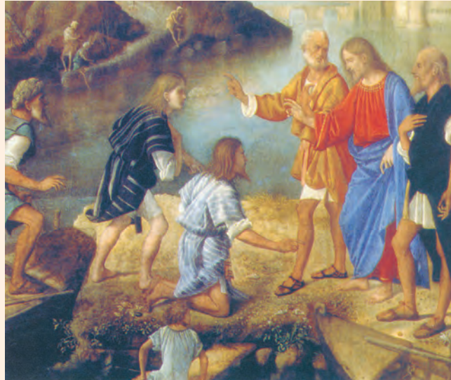
Jesús crida els fills de Zebedeu. Pintura de M. Basaiti (any 1515), Museu de Belles Arts de Viena

Un poco más adelante vio a Santiago, hijo de Zebedeo, y a su hermano Juan, que estaban en la barca repasando las redes. Los llamó, dejaron a su padre Zebedeo en la barca con los jornaleros y se marcharon con él.