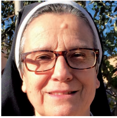
Aquesta imatge parla