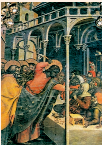
Jesús expulsa els mercaders del temple. Pintura de Castiglione, Museu del Prado (Madrid)

Se acercaba la Pascua de los judíos, y Jesús subió a Jerusalén. Y encontró en el templo a los vendedores de bueyes, ovejas y palomas, y a los cambistas sentados; y, haciendo un azote de cordeles, los echó a todos del templo, ovejas y bueyes; y a los cambistas les esparció las monedas y les volcó las mesas; y a los que vendían palomas les dijo: «Quitad esto de aquí; no convertáis en un mercado la casa de mi Padre.» Sus discípulos se acordaron de lo que está escrito: «El celo de tu casa me devora.» Entonces intervinieron los judíos y le preguntaron: «¿Qué signos nos muestras para obrar así?» Jesús contestó: «Destruíd este templo, y en tres días lo levantaré.» Los judíos replicaron: «Cuarenta y seis años ha costado construir este templo, ¿y tú lo vas a levantar en tres días?» Pero él hablaba del templo de su cuerpo. Y, cuando resucitó de entre los muertos, los discípulos se acordaron de que lo había dicho, y dieron fe a la Escritura y a la palabra que había dicho Jesús.