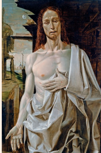
Crist ressuscitat. Pintura del Bramantino (Bartolomeo Suardi, 1450-1536), Museu Thyssen-Bornemisza (Madrid)

«Entonces sabréis que yo estoy con mi Padre, y vosotros conmigo y yo con vosotros. El que acepta mis mandamientos y los guarda, ese me ama; al que me ama lo amaré mi Padre, y yo también lo amaré y me revelaré a él.»