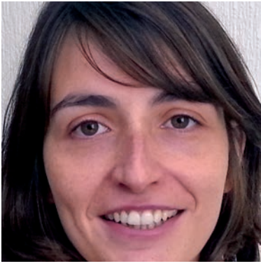
Aquesta imatge parla