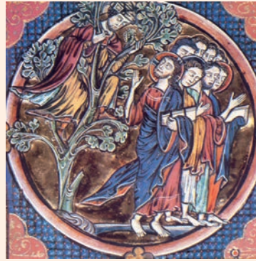
Jesús parla a Zaqueu, enfilat a un arbre. Miniatura del Còdex de Sant Lluís, Catedral de Toledo

Totes les obres del Senyor són fidels, / les seves obres són obres d'amor. / El Senyor sosté els qui estan a punt de caure, / els qui han ensopegat, ell els redreça. R.