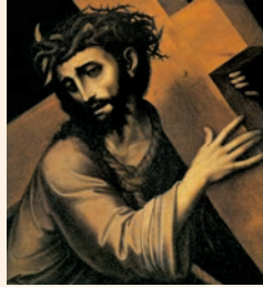
Crist portant la creu (fragment). Obra de Luis de Morales, Galeria degli Uffizi (Florència)

Obriu-me els llavis, Senyor, / i proclamaré la vostra lloança. / La víctima que ofereixo és un cor penedit; / un esperit que es penedeix, / vós, Déu meu, no el menyspreu. R.