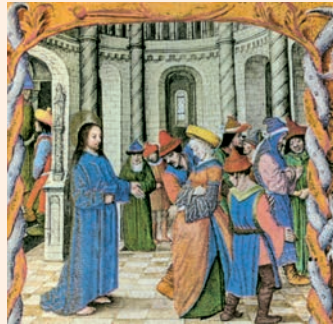
Miniatura sobre l'episodi de Crist i la dona adúltera. Del Breviari d'Isabel la Catòlica. British Library (Londres)

Al ir, iba llorando, / llevando la semilla; / al volver, vuelve cantando, / trayendo sus gavillas. R.