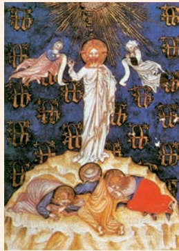
La Transfiguració de Jesús. Miniatura del Missal franciscà (s. XIV), Biblioteca Nacional de París

Aquel día el Señor hizo alianza con Abrahán en estos términos: «A tus descendientes les daré esta tierra, desde el río de Egipto al Gran Río Éufrates.»