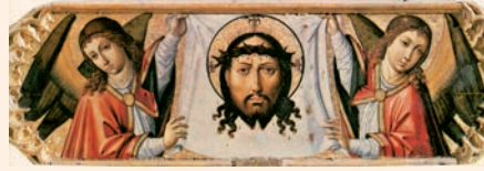
Santa Faç del Crist sofrent. Pintura del Mestre de Perea, València

En sentir això, tots els qui eren a la sinagoga, indignats, es posaren a peu dret, el tragueren del poble i el dugueren cap a un cingle de la muntanya on hi havia el poble per estimbar-lo. Però ell se n'anà passant entremig d'ells.