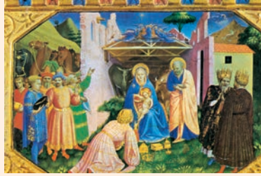
L'adoració dels Reis. Pintura de Fra Angelico, Museu del Prado (Madrid)

Després, advertits en un somni que no anessin pas a veure Herodes, se'n tornaren al seu país per un altre camí.