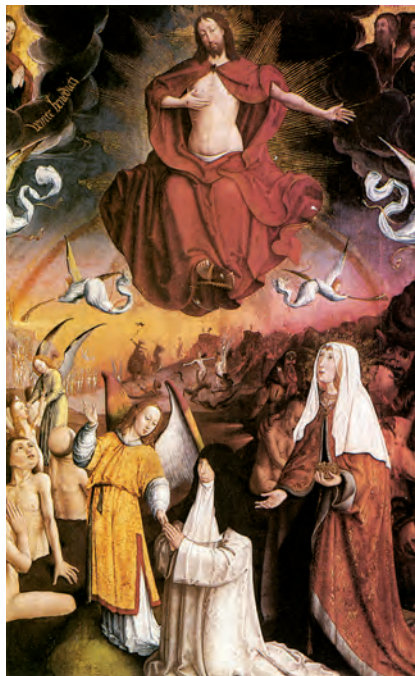
El judici final (detall), oli sobre taula de Van der Weyden (c. 1445-50). Musée de l'Hôtel-Dieu, Beaune (França)

»Entonces verán venir al Hijo del hombre sobre las nubes con gran poder y majestad; enviará a los ángeles para reunir a sus elegidos de los cuatro vientos, de horizonte a horizonte. Aprended de esta parábola de la figuera: Cuando las ramas se ponen tiernas y brotan las yemas, deducís que el verano está cerca; pues cuando veáis vosotros suceder esto, sabed que él está cerca, a la puerta. Os aseguro que no pasará esta generación antes que todo se cumpla. El cielo y la tierra pasarán, mis palabras no pasarán. El día y la hora nadie lo sabe, ni los ángeles del cielo ni el Hijo, sólo el Padre.»