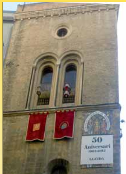
Capella del Peu del Romeu. Seu de l'Agrupació Ilerdenca de Pessebristes

Per poder participar en la Trobada, cal fer la corresponent inscripció, la qual dona dret a participar en tots els actes, inclosos l'esmorzar i el Dinar de Germanor.