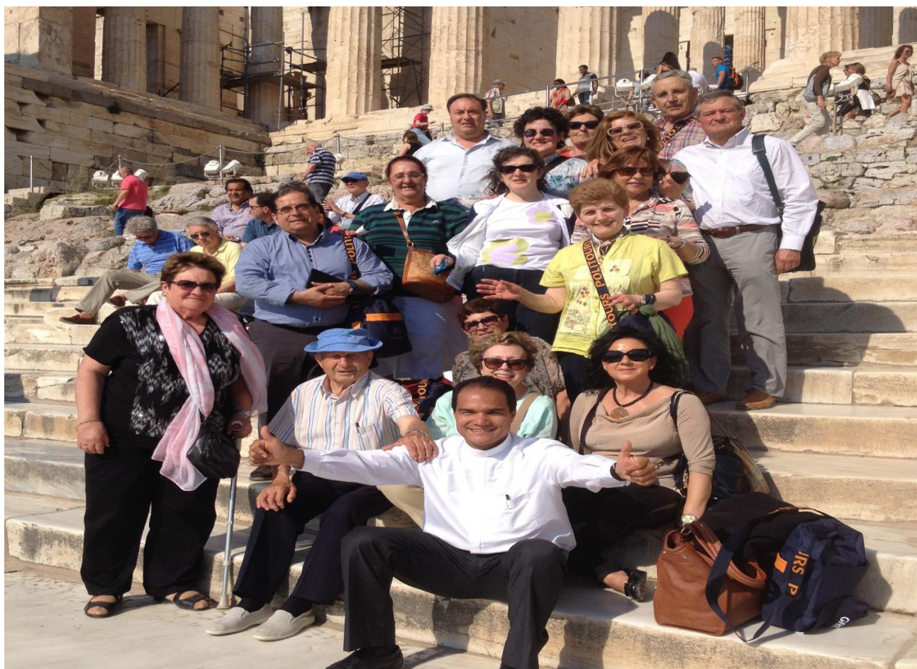
Imatge de l'Areòpag d'Atenes des d'on Sant Pau predicà la resurrecció

Ha estat una experiència espiritual molt gratificant poder gaudir de les Escriptures en els llocs estratègics on Sant Pau va predicar: Tessalònica, Filip, Corint i Atenes. És una experiència religiosa recomanable que invita a la germanor i a gaudir d'uns dies en comunitat. Les misses les vam celebrar en plena natura: jardins, rierols i restes arqueològiques doncs l'Església ortodoxa no permet el ritual catòlic a l'interior dels seus edificis.