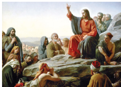
Sermó de la muntanya (1877) de Carl Heinrich Bloch. Museu d'Història Nacional, Castell de Frederiksborg (Dinamarca)

Què és el que alegra els rebutjats pel món per causa de Crist? S'alegren d'haver trobat quelcom que val més que tot el món.