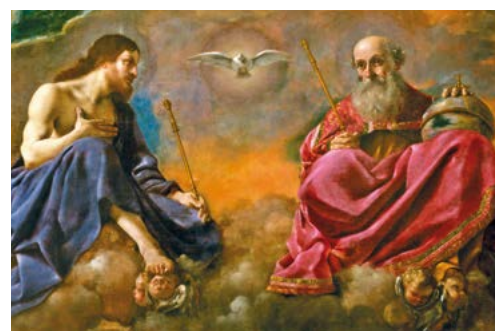
La Santíssima Trinitat (1616-1617) de Giovanni Francesco Barbieri (Il Guercino). Palau Magnani, Bolonya (Itàlia)