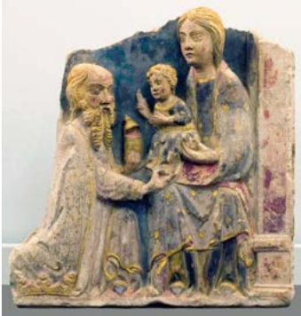
Fragmento de la Epifanía del retablo de la cripta de la Colegiata de Áger. Circa 1370-1390. Museo de Lleida

La Navidad es una fiesta muy especial para todos, Mucho más para los cristianos que celebran el nacimiento de su Salvador, el Mesías anunciado por los profetas con sus palabras y gestos, por los patriarcas, reyes y jueces del pueblo elegido que vivían pendientes de este gran acontecimiento que se produciría en la plenitud de los tiempos. Es el Hijo de Dios que nace y nos revela su amor a toda la humanidad.