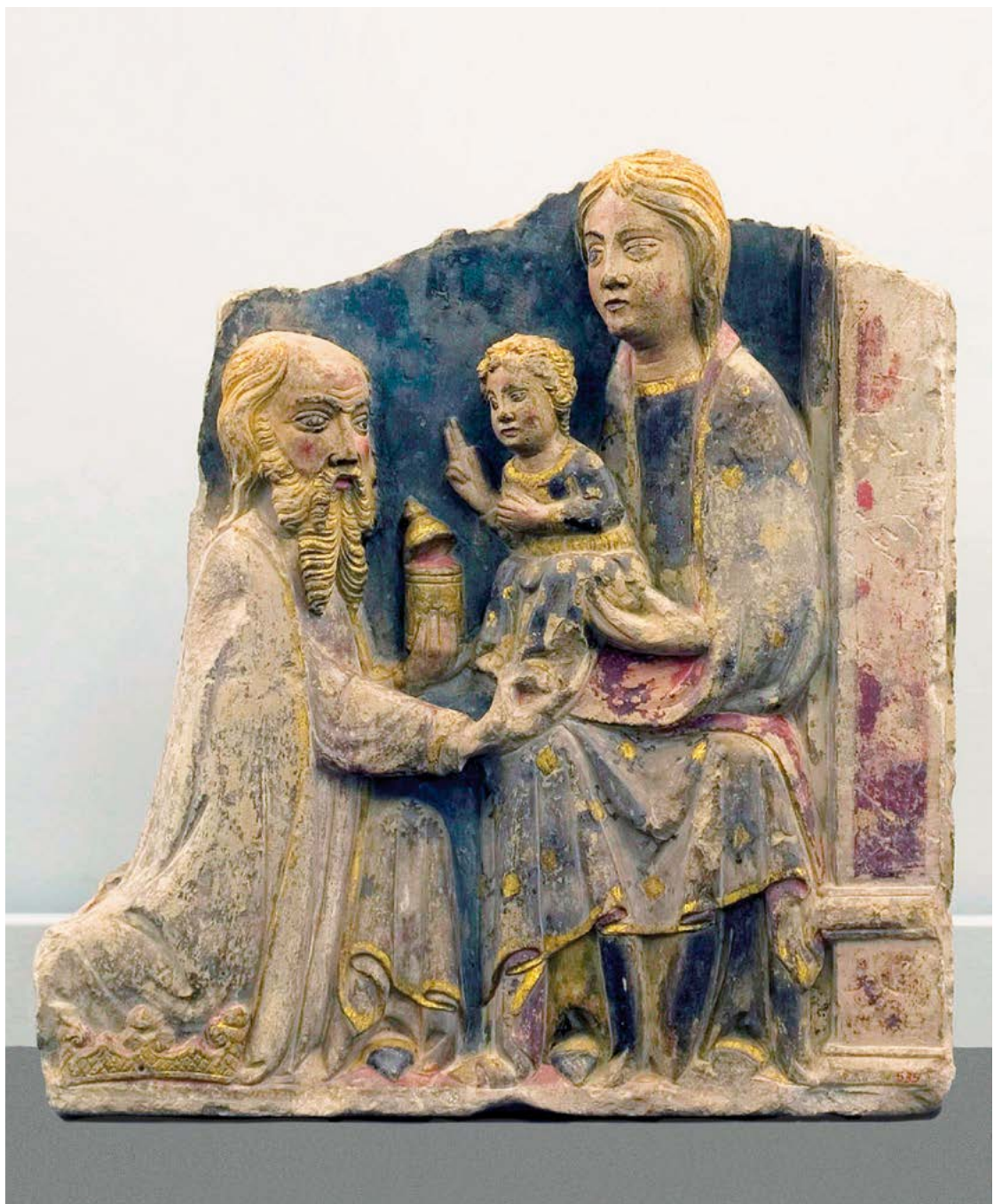
Fragment de l'Epifania del retaule de la cripta de la Col·legiata d'Àger. Circa 1370-1390. Museu de Lleida

Ajuda'ns a no quedar-nos en els bons desitjos i a traduir-los en compromisos per transformar. Fes fecund, Senyor, el nostre servei. Dona'ns la força de l'Esperit perquè la teva Paraula i els nostres desitjos arribin a fer-se realitat.