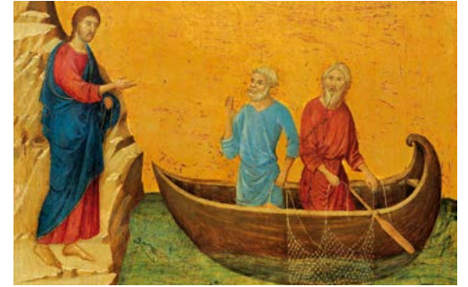
Vocació dels apòstols Pere i Andreu (1308-1311). Retaule de la Maestà de Duccio di Buoninsegna. Museu de la catedral de Siena (Itàlia)