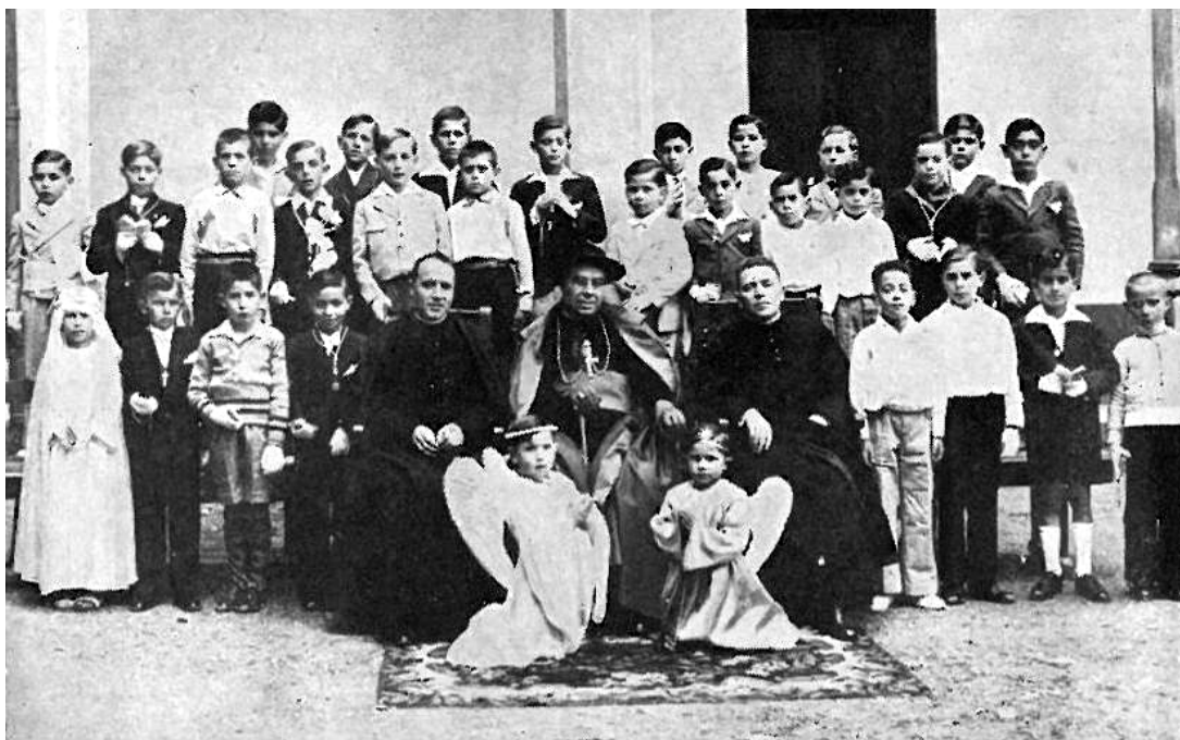
Primera comunión en la escuela preparatoria del Seminario de Lleida.

En el verano de 1935, tuve el placer de hacerle una visita en Lleida y, como si nada hubiese cambiado y nos encontráramos todavía en aquellas diarias visitas que hacía en Ibiza a las obras del edificio de Acción Católica o del Colegio de la Consolación, me invitó para que le acompañara a visitar las obras que bajo su dirección se hacían en el Seminario Conciliar, adaptando una parte del edificio para Asilo de ancianos sacerdotes. Conmovía ver la delicadeza de su corazón de padre atendiendo a los menores detalles para que la estancia les fuera lo más cómoda, alegre y sana posible; recomendaba encarecidamente a los maestros de obras la ausencia total de peldaños para que, cualquiera que fuese el estado físico de los ancianos, pudieran trasladarse a la capilla, comedor, sala de lectura y al jardín sin peligro ni dificultad.