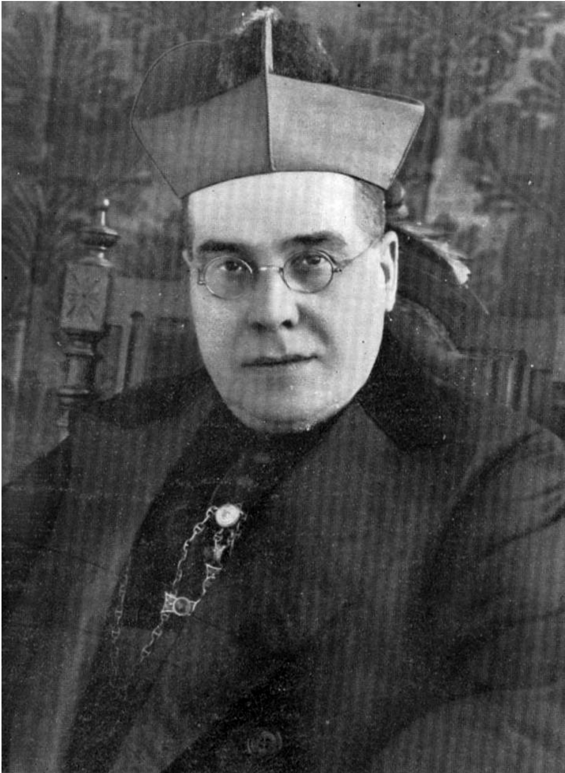
Mons. Salvio Huix Miralpeix, Obispo de Lleida.