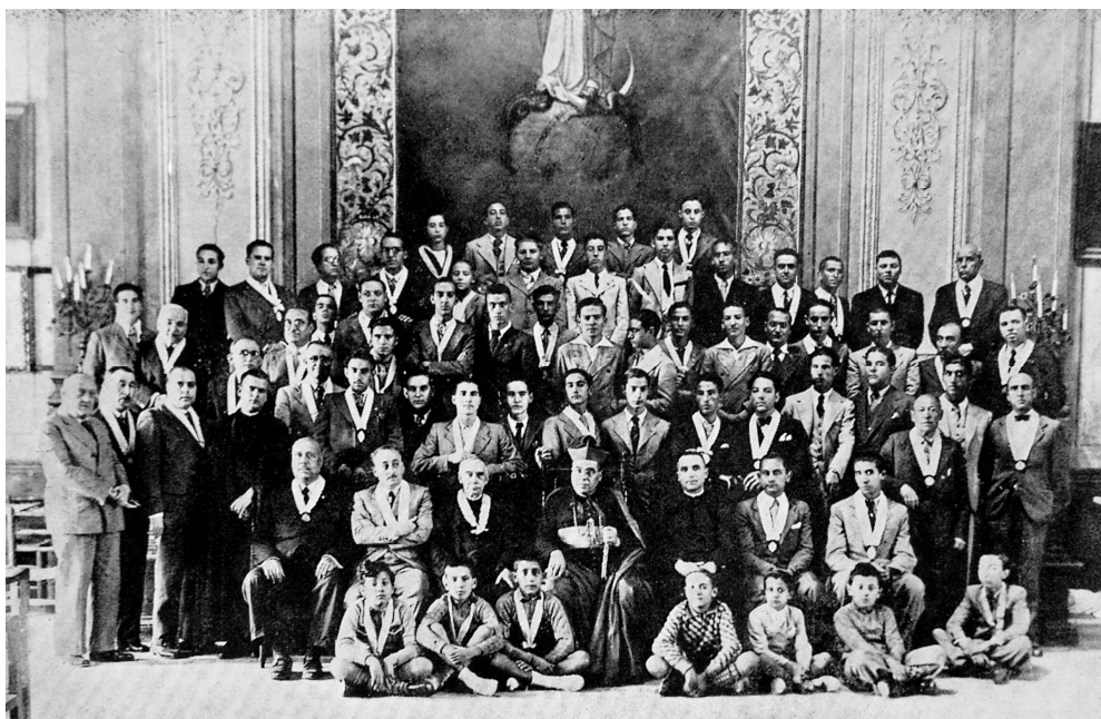
Congregaciones Marianas. Academia Mariana de Lleida, 1936.

Los que tuvieron la dicha de comunicar y colaborar con él en las distintas obras de apostolado, lo recuerdan todavía con verdadera nostalgia. No es, pues, de extrañar que, al ser confirmadas sus virtudes con los ejemplos maravillosos que les dio desde la cárcel y en el martirio, los leridanos hablen con orgullo de su Obispo mártir y estén rogando fervorosamente al Señor se digne manifestar en él su propia gloria, anhelando verle en los altares. A la cabeza del clero, y como asumiendo su representación, el Excmo. Cabildo Catedral de Lleida ha promovido el proceso de Beatificación. Justo es hacer resaltar aquí este hecho de significación hondísima y de no menor ejemplaridad. 2