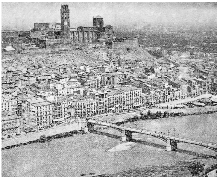
Vista general de Lleida.

Por de pronto suspendió, en cuanto hubo cumplido los primeros deberes de cortesía y protocolo, su paseo diario por la tarde. Su única distracción fueron, diariamente, unas vueltas dadas por la huerta del Palacio, durante media hora. Multitud de visitas le tenían ocupado hasta las dos de la tarde; el estudio de los diversos e importantes problemas que se le iban presentando, la oración que intensificó todavía más, le absorbían el resto de las horas del día y de la noche.