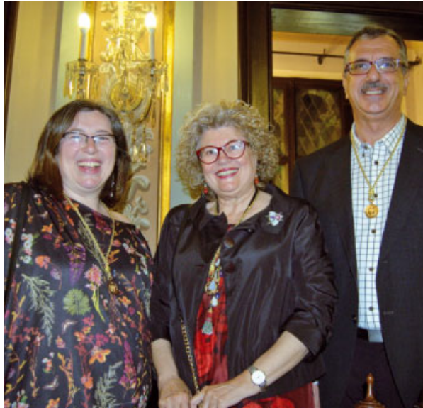
Cal recordar que enguany es va commemorar el mig segle d'aquest esdeveniment.