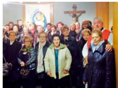
Santa Àgata a Alcarràs