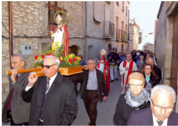
Visita a Almatret