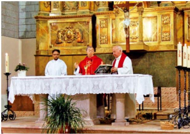
Visita a Maials