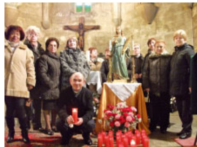
Santa Àgata a Sarroca

La Parròquia de l'Assumpció de la Mare de Déu d'Alcarràs també va ser fidel a aquesta tradició, manifestant les dones del poble la seva devoció a la santa. També van reivindicar, des de la fe, els seus drets a una bona convivència.