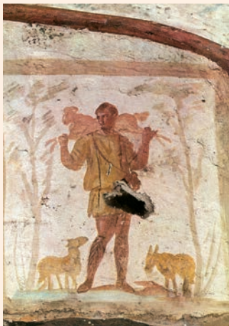
Crist, el bon pastor. Pintura mural de les Catacumbes de Sant Calixt (Roma, segle III)

Beneït el qui ve en nom del Senyor. / Us beneïm des de la casa del Senyor. / Vós sou el meu Déu, us dono gràcies, / us exalço, Déu meu! / Enaltiu el Senyor: Que n'és de bo! / Perdura eternament el seu amor. R.