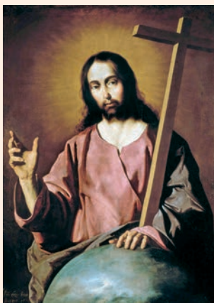
El Salvador beneito. Pintura de F. Zurbarán (1598-1664), Museu del Prado (Madrid)

»Ahora mi alma está agitada, y ¿qué diré?: Padre, líbrame de esta hora. Pero si por esto he venido, para esta hora. Padre, glorifica tu nombre.» Entonces vino una voz del cielo: «Lo he glorificado y volveré a glorificarlo.» La gente que estaba allí y lo oyó decía que había sido un trueno; otros decían que le había hablado un ángel. Jesús tomó la palabra y dijo: «Esta voz no ha venido por mí, sino por vosotros. Ahora va a ser juzgado el mundo; ahora el Príncipe de este mundo va a ser echado fuera. Y cuando yo sea elevado sobre la tierra atraeré a todos hacia mí.» Esto lo decía dando a entender la muerte de que iba a morir.