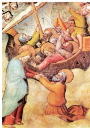
Jesús dona la mà a Sant Pere. Pintura de Nicolás Florentino, retaule de la Catedral Vella (Salamanca)

De madrugada se les acercó Jesús, andando sobre el agua. Los discípulos, viéndole andar sobre el agua, se asustaron y gritaron de miedo, pensando que era un fantasma. Jesús les dijo enseguida: «¡Ánimo, soy yo, no tengáis miedo!» Pedro le contestó: «Señor, si eres tú, mándame ir hacia ti andando sobre el agua.» Él le dijo: «Ven.» Pedro bajó de la barca y echó a andar sobre el agua, acercándose a Jesús; pero, al sentir la fuerza del viento, le entró miedo, empezó a hundirse y gritó: «Señor, sálvame.» Enseguida Jesús extendió la mano, lo agarró y le dijo: «¡Qué poca fe! ¿Por qué has dudado?» En cuanto subieron a la barca, amainó el viento. Los de la barca se postraron ante él, diciendo: «Realmente eres Hijo de Dios.»