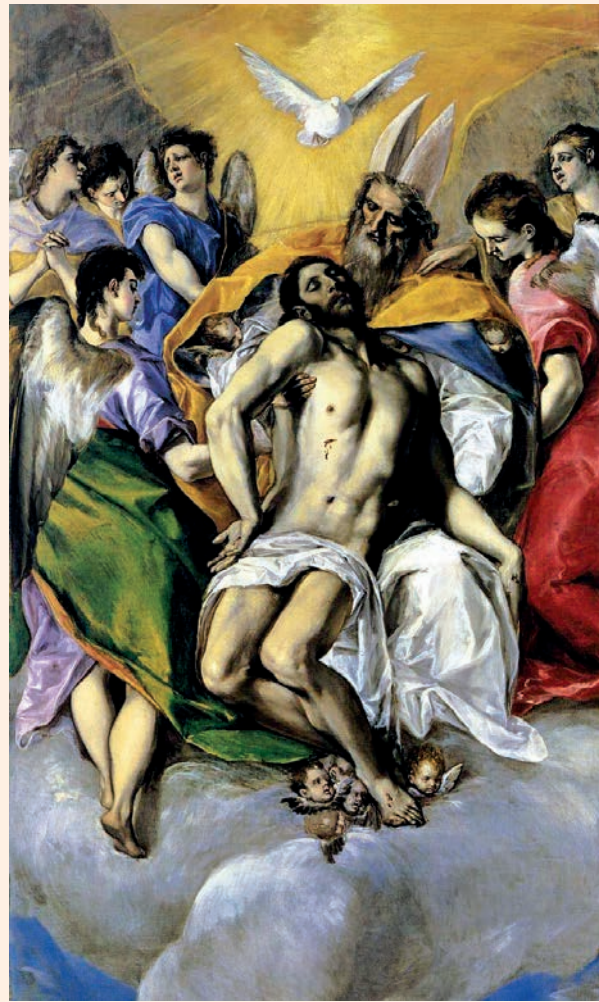
La Santísima Trinitat. Pintura d'El Greco (Domenico Theotocopoli, 1541/1542-1614)

Tanto amó Dios al mundo que entregó a su Hijo único para que no perezca ninguno de los que creen en él, sino que tengan vida eterna. Porque Dios no mandó su Hijo al mundo para juzgar al mundo, sino para que el mundo se salve por él. El que cree en él no será juzgado; el que no cree ya está juzgado, porque no ha creído en el nombre del Hijo único de Dios.