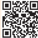
Accés al Breviari