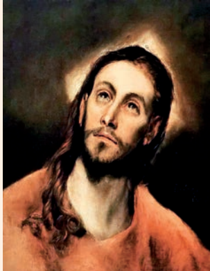
Rostre del Crist. Pintura d'El Greco, que es conserva a Praga (en el quart centenari de la mort del pintor, any 1614)

Habéis oído que se dijo: "Amarás a tu prójimo" y aborrecerás a tu enemigo. Yo, en cambio, os digo: Amad a vuestros enemigos, y rezad por los que os persiguen. Así seréis hijos de vuestro Padre que está en el cielo, que hace salir su sol sobre malos y buenos, y manda la lluvia a justos e injustos. Porque, si amáis a los que os aman, ¿qué premio tendréis? ¿No hacen lo mismo también los publicanos? Y, si saludáis sólo a vuestros hermanos, ¿qué hacéis de extraordinario? ¿No hacen lo mismo también los gentiles? Por tanto, sed perfectos, como vuestro Padre celestial es perfecto.»