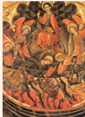
La caiguda dels àngels rebels (evangeli d'avui). Pintura (vers 1473) del retaule de Sant Miquel i Sant Pere, de la Seu d'Urgell, MNAC (Barcelona)

Los setenta y dos volvieron muy contentos y le dijeron: «Señor, hasta los demonios se nos someten en tu nombre.» Él les contestó: «Veía a Satanàs caer del cielo como un rayo. Mirad: os he dado potestad para pisotear serpientes y escorpiones y todo el ejército del enemigo. Y no os hará daño alguno. Sin embargo, no estéis alegres porque se os someten los espíritus; estad alegres porque vuestros nombres están inscritos en el cielo.»