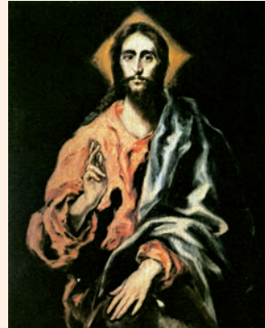
El Salvador. Pintura d'El Greco, sagristia de la catedral de Toledo

M'ensenyareu el camí que duu a la vida: / joia i festa a desdir a la vostra presència; / al vostre costat, delícies per sempre. R.