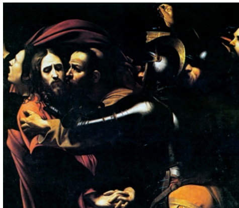
«El Fill de l'home serà entregat». Jesús a Getsemaní , pintura de Caravaggio (Museu d'Art Occidental i Oriental, Odessa)

En aquel tiempo, Jesús y sus discípulos se marcharon de la montaña y atravesaron Galilea; no quería que nadie se enterase, porque iba instruyendo a sus discípulos. Les decía: «El Hijo del hombre va a ser entregado en manos de los hombres, y lo matarán; y, después de muerto, a los tres días resucitará.» Pero no entendían aquello, y les daba miedo preguntarle. Llegaron a Cafarnaüm, y, una vez en casa, les preguntó: «¿De qué discutíais por el camino?» Ellos no contestaron, pues por el camino habían discutido quién era el más importante. Jesús se sentó, llamó a los Doce y les dijo: «Quien quiera ser el primero, que sea el último de todos y el servidor de todos.» Y, acercando a un niño, lo puso en medio de ellos, lo abrazó y les dijo: «El que acoge a un niño como este en mi nombre me acoge a mí; y el que me acoge a mí no me acoge a mí, sino al que me ha enviado.»