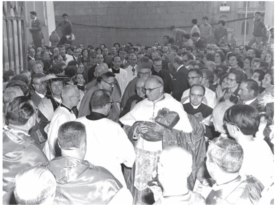
Celebració de l'ordenació episcopal (27/10/1968).

vindrien després i que va comportar que tot Catalunya fos governada per bisbes del territori.