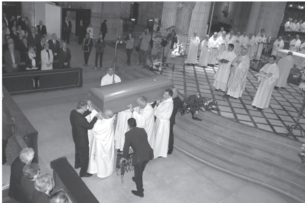
El funeral i enterrament es va celebrar a la catedral nova de Lleida.

seu testimoniatge fins al darrer moment».