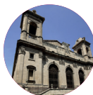
† Salvador Giménez Valls Bisbe de Lleida

Aquesta jornada també serveix per a explicar a la societat en general la situació econòmica: Com i de qui rebem donatius i, per descomptat, el destí de les ajudes que arriben per al manteniment del nostre patrimoni, per al funcionament ordinari i per a compartir amb els més necessitats.