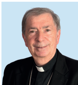
† Salvador Giménez Valls Obispo de Lleida

Gratitud que se extiende a todos aquellos que, viendo la labor de las instituciones de Iglesia, valoran positivamente su actividad y aportan sus donativos para tal fin.