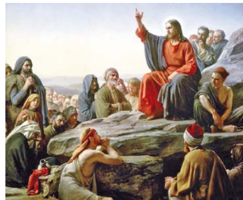
Sermó de la muntanya (1877), de Carl Bloch. Museu Nacional d'Història, Hillerød (Dinamarca)

«Feliços els pobres, els compassius, els nets de cor, els perseguits...»