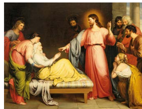
La curació de la sogra de Pere (1839), de John Bridges. Museu d'Art de Birmingham (Anglaterra)