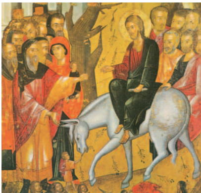
Entrada de Jesús a Jerusalem, icona bizantina, Nicòsia

El centurión, al ver lo que pasaba, daba gloria a Dios diciendo: S. «Realmente, este hombre era justo». C. Toda la muchedumbre que había acudido a este espectáculo, habiendo visto lo que ocurría, se volvían dándose golpes de pecho. Todos sus conocidos se mantenían a distancia, y lo mismo las mujeres que lo habían seguido desde Galilea y que estaban mirando.