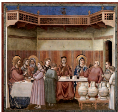
Les noces de Canà. Pintura del Giotto (vers 1406), Capella de l'Arena, Pàdua (Itàlia)

Así, en Caná de Galilea Jesús comenzó sus signos, manifestó su gloria y creció la fe de sus discípulos en él.