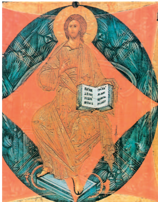
Crist, Salvador entre les Potències, Icona dels segles xv-xvi, Novgorod, Rússia

El día y la hora nadie lo sabe, ni los ángeles del cielo ni el Hijo, sólo el Padre.»