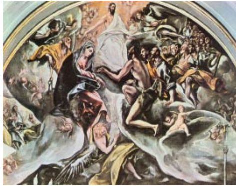
Glorificació del Crist ressuscitat. Part superior de la pintura Entierro del Conde de Orgaz , del Greco. Església de Sant Tomé. Toledo

Que és rei de tot el món, / canteu a Déu un himne. / Déu regna sobre les nacions, / Déu seu al tron sagrat. R.