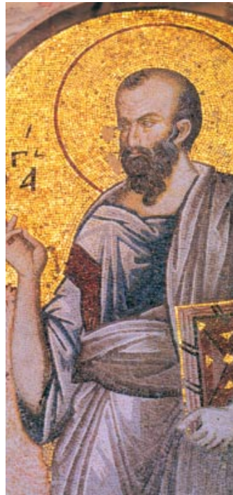
Mosaic de Sant Pau. Museu de Chora, Constantinoble (actual Istanbul)

Mientras estaba en Jerusalén por las fiestas de Pascua, muchos creyeron en su nombre, viendo los signos que hacía; pero Jesús no se confiaba con ellos, porque los conocía a todos y no necesitaba el testimonio de nadie sobre un hombre, porque él sabía lo que hay dentro de cada hombre.