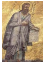
Mosaico del ábside de la Basílica de San Pablo Extramuros, Roma

P or mandato divino y por carácter, Pablo tenía que ser jefe de misión. Y lo fue a partir de ese momento. Para Bernabé quedaban grandes territorios (Siria, Cilicia, Chipre, Frigia, Licaonia...); Pablo se iría a lugares donde Cristo nunca había sido anunciado. Empezando por Galacia, en torno a Ancira (=Ankara), en el centro de la actual Turquía. Pero allí le atacó una enfermedad de la piel, que comprometía a fondo su ministerio. Sin embargo inexplicablemente la gente se convirtió, y no se formó una sino varias comunidades locales.