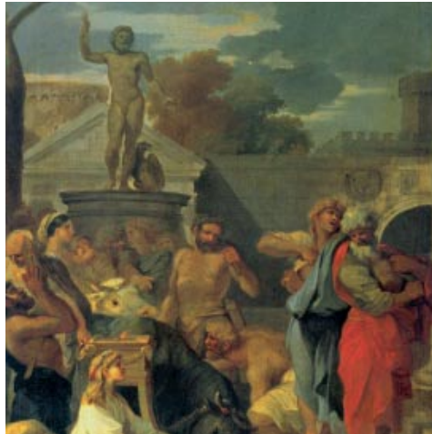
Sant Pau i sant Bernabé a Listra. Pintura de Sébastien Bourdon (1616-1671). Museu del Prado. Madrid

Ompli de béns els pobres, / i els rics se'n tornen sense res. / Ha protegit Israel, el seu servent, / s'ha recordat del seu amor. R.