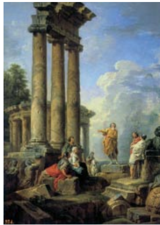
Ruines i Sant Pau predicant. Pintura de Giovanni Paolo Panini (1691-1765). Museu del Prado. Madrid

Y entonces dirá a los de su izquierda: «Apartaos de mí, malditos, id al fuego eterno preparado para el diablo y sus ángeles. Porque tuve hambre y no me disteis de comer, tuve sed y no me disteis de beber, fui forastero y no me hospedasteis, estuve desnudo y no me vestisteis, enfermo y en la cárcel y no me visitasteis.» Entonces también éstos contestarán: «Señor, ¿cuándo te vimos con hambre o con sed, o forastero o desnudo, o enfermo o en la cárcel, y no te asistimos?» Y él replicará: «Os aseguro que cada vez que no lo hicisteis con uno de éstos, los humildes, tampoco lo hicisteis conmigo.» Y éstos irán al castigo eterno, y los justos a la vida eterna.»