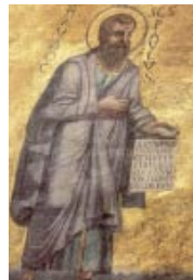
Mosaico del ábside de la Basílica de San Pablo Extramuros, Roma

Tanto Pablo como Bernabé pensaron en llevar el Evangelio a sus tierras de origen: Tarso y Chipre. Tarso estaba cerca de Antioquía: pronto quedó incorporada al movimiento de aquella comunidad.