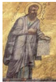
Mosaico del ábside de la Basílica de San Pablo Extramuros, Roma

Habían transcurrido unos tres años desde su conversión. Pablo hubiera podido subir antes a Jerusalén, a tomar contacto con los que eran apóstoles antes que él. Pero antes hubiera podido contarles sólo una experiencia; ahora (seguro que le acompañaba algún testigo) podía hablar de las conversiones que había realizado y de las persecuciones que había sufrido: dos signos que le acreditaban como apóstol de Jesucristo y como portador de su cruz.