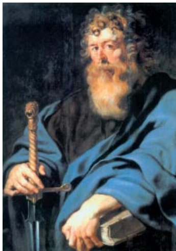
Sant Pau. Pintura de Rubens. Museu del Prado. Madrid

Entonces intervinieron los judíos y le preguntaron: «¿Qué signos nos muestras para obrar así?» Jesús contestó: «Destruid este templo, y en tres días lo levantaré.» Los judíos replicaron: «Cuarenta y seis años ha costado construir este templo, ¿y tú lo vas a levantar en tres días?» Pero él hablaba del templo de su cuerpo. Y, cuando resucitó de entre los muertos, los discípulos se acordaron de que lo había dicho, y dieron fe a la Escritura y a la palabra que había dicho Jesús.