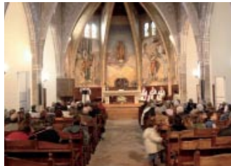
Església del Sagrat Cor de Jesús de Raimat

Cada persona, grup i/o comunitat, tenim particularitats innegables però tenim en comú que som (individualment i comunitària) «Església de (i en) Lleida» i, a la vegada, «ciutadans», membres d'una societat humana ben concreta i amb múltiples relacions socials, econòmiques, polítiques, culturals, etc. I això ens demana no ignorar pastoralment l'entramat humà en el que vivim. Distingir sí, però no separar la fe i la vida. La fórmula que es va fer famosa durant la transició espanyola («mútua col·laboració i sana independència») pot ser vàlida per a tots els temps.