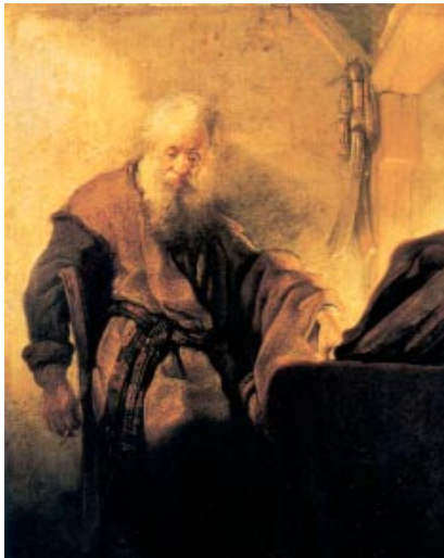
Sant Pau Apòstol. Pintura de Rembrandt

En aquel tiempo, los fariseos, al oír que Jesús había hecho callar a los saduceos, formaron grupo, y uno de ellos, que era experto en la Ley, le preguntó para ponerlo a prueba: «Maestro, ¿cuál es el mandamiento principal de la Ley?» Él le dijo: «Amarás al Señor, tu Dios, con todo tu corazón, con toda tu alma, con todo tu ser.» Este mandamiento es el principal y primero. El segundo es semejante a él: «Amarás a tu prójimo como a ti mismo.» Estos dos mandamientos sostienen la Ley entera y los Profetas.»