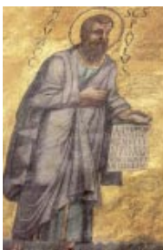
Mosaico del ábside de la Basílica de San Pablo Extramuros, Roma

P ablo hubiera discutido con cualquiera su aversión a los cristianos. Para él era evidente que, sobre todo en tierra pagana, quien, por la razón que sea (por eso de que «el sábado es para el hombre») abandonaba prácticas de la Ley, terminaba siendo un pagano más.