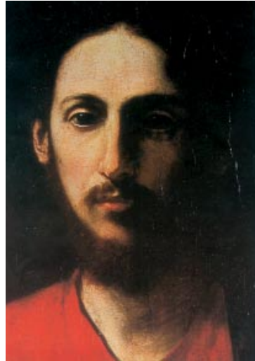
Rostre de Crist. Quadre de José Ribera (fragment), 1591-1652. Museu del Prado, Madrid.

El Señor es bueno y es recto, / y enseña el camino a los pecadores; / hace caminar a los humildes con rectitud, / enseña su camino a los humildes. R.