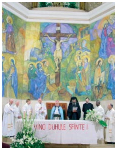
Acte ecumènic celebrat a la parròquia del Carme de Lleida l'1 d'octubre de 2005, en honor de la Mare de Déu de la Unitat

E l diable va voler investigar com pregaven els éssers humans. Les averiguacions foren curtes i profitoses. Havia arribat a una certesa: Que, entre els humans, no hi havia massa interès per la pregària. Tornava satisfet a casa, quan va veure en un camp un pagès que cridava i movia amenaçadors els braços. Va voler saber què passava i es va amagar. Va veure un home que estava discutint violentament amb Déu. L'injuriava, li deia unes barbaritats