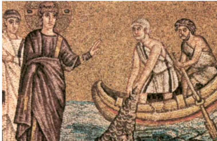
Jesus crida els primers apòstols. Mosaic de l'església de Sant Apol·linar Nou, de Ravenna (Itàlia)

El Senyor, bondadós i recte, / ensenya el bon camí als pecadors. / Encamina els humils per sendes de justícia, / els ensenya el seu camí. R.